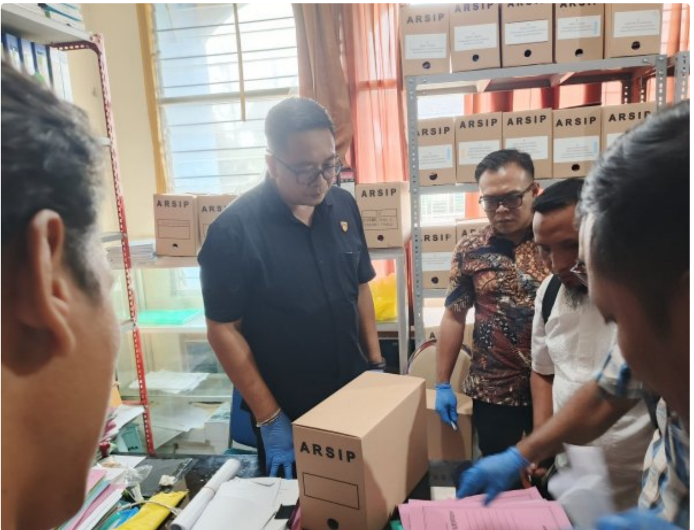
Saat Penggeledahan di Dikbud NTB, Jumat (13/12/2024)